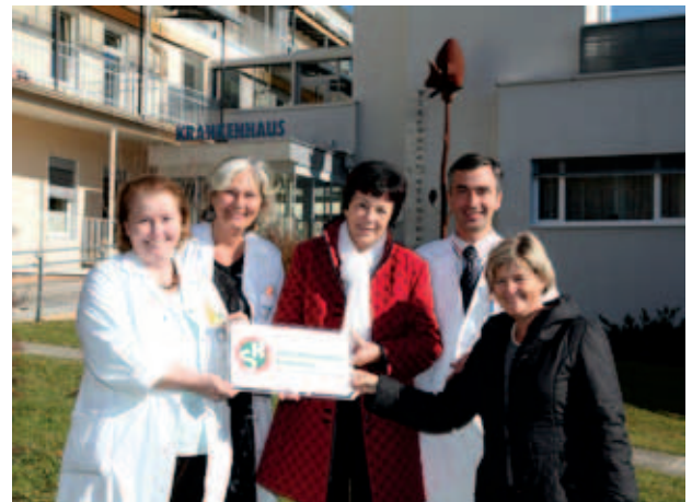
Patientenorientierung wird im Krankenhaus Waiern tatsächlich gelebt.

Die Zusammenarbeit zwischen Selbsthilfe und Krankenhaus hat in Kärnten bereits eine lange Tradition und ist ein wesentlicher Beitrag zur Stärkung der Selbsthilfeaktivitäten innerhalb des Gesundheitswesens. Durch die Zusammenarbeit wird ein selbsthilfefreundliches und kooperatives Klima in der Öffentlichkeit gefördert und für PatientInnen bzw. deren Angehörige der Zugang zu spezifischen Selbsthilfegruppen erleichtert.